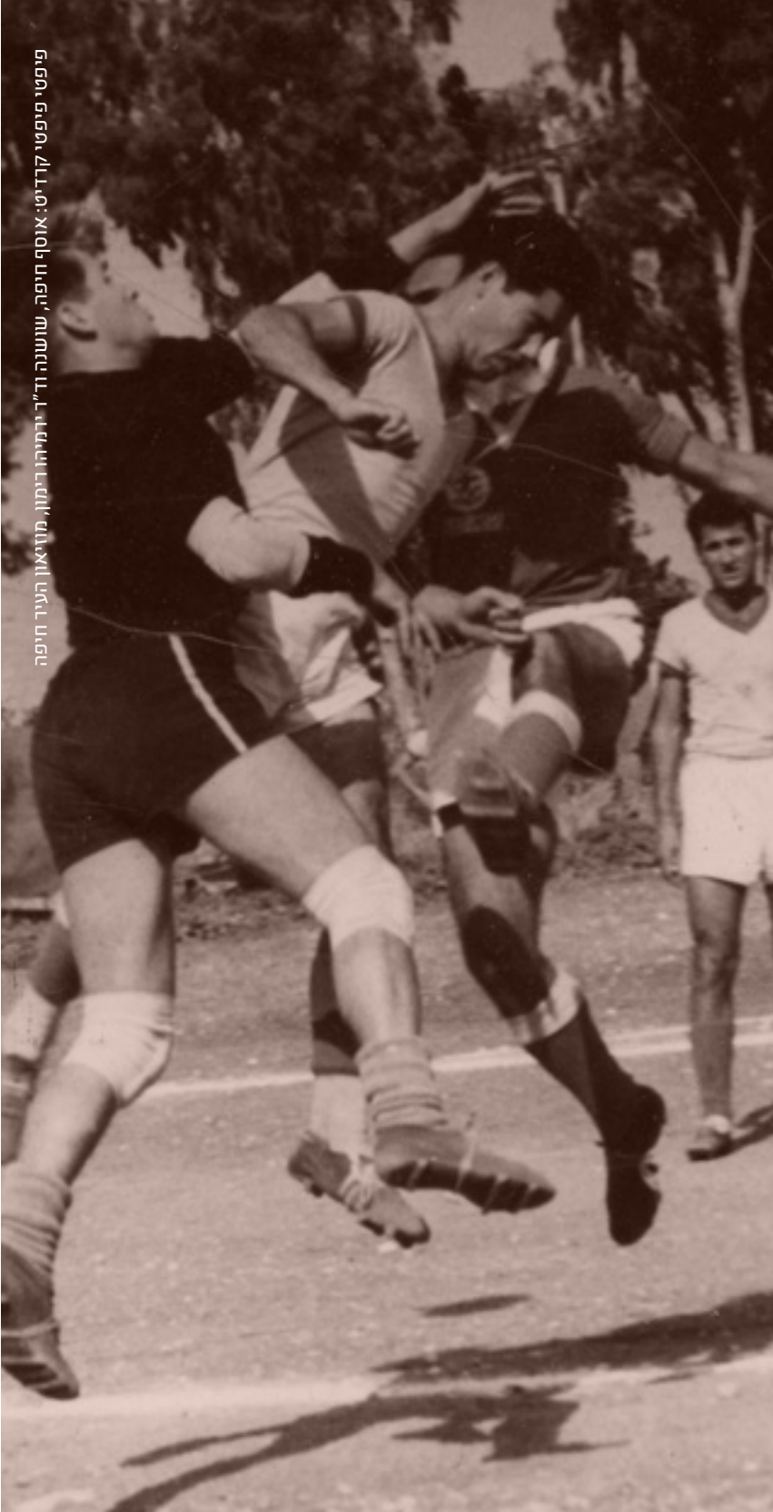
פיפטי פיפטי